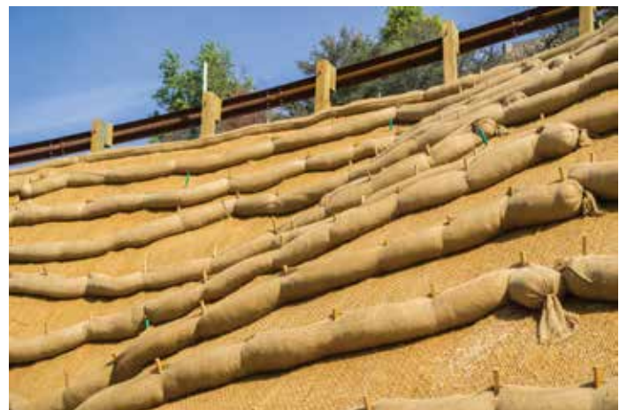
GREENMAT™ & ECOLOG™