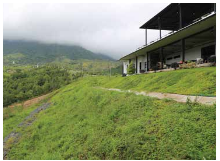
AFTER INSTALLATION 6-8 MONTHS