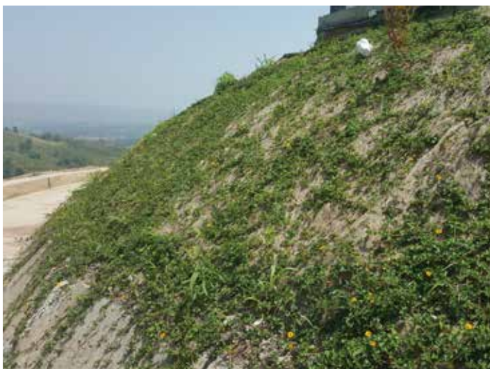
AFTER INSTALLATION 2-3 MONTHS