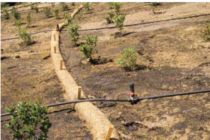
ECOLOG™ ON SLOPE