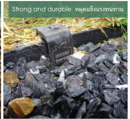
Strong and durable ทนแดดแข็งแรงทนทาน