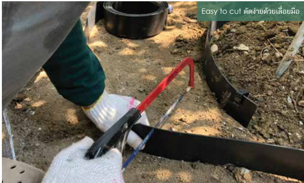
Easy to cut ตัดง่ายด้วยเลื่อยมือ