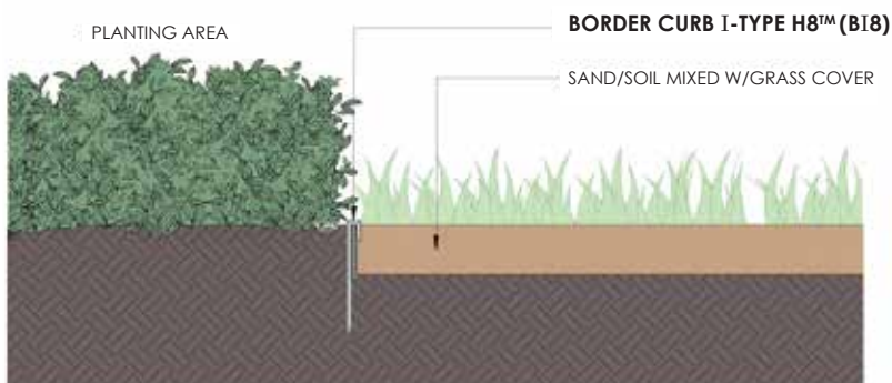
TYPICAL INSTALLATION BORDER CURB I-TYPE H8™ (BI8) WITH GRASS