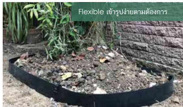
Flexible เข้ารูปง่ายตามต้องการ