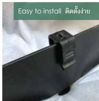
Easy to install ติดตั้งง่าย