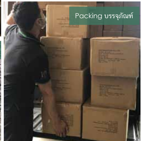
Packing บรรจุภัณฑ์